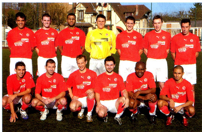
L'équipe «Fanion» de l'USSP saison 2006/2007