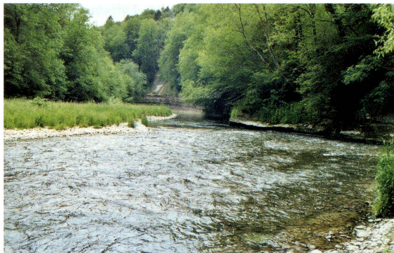
Le cours naturel de la Töss en aval d'Embrach (ZH).

Cette nouvelle disposition constitutionnelle charge les cantons d'ordonner des mesures en vue d'encourager la renaturation des eaux publiques telles que lacs et cours d'eau ainsi que de leurs zones riveraines. Pour ce faire, les cours d'eau doivent être mieux interconnec-