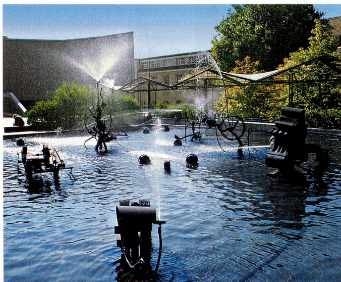
La Fontaine Tinguely de Bâle, appréciée des autochtones comme des visiteurs

L'OSE est prête à monter sur la brèche et à reprendre le travail de Swiss Ping Pong à compter d'octobre 2006, dans le cadre de ses offres pour les jeunes. Désireux de faire connaître nos offres aussi en Suisse romande, nous y cherchons des partenaires et des familles d'accueil. L'OSE espère pouvoir reprendre autant d'amis que possible du gigantesque réseau que Swiss Ping Pong a constitué jusqu'ici.