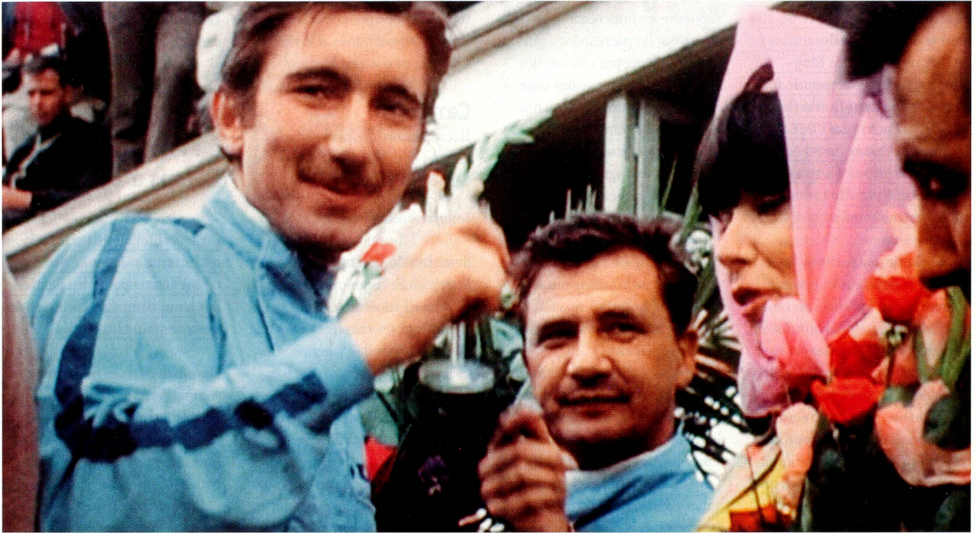
Joe Siffert en 1967 après une course avec des amis et sur l'affiche du film (en bas).

courageux et faire les choses avec enthousiasme!» Durant les entretiens avec les proches de Siffert, Men Lareida a constaté, chose plutôt rare dit-il, qu'il n'a jamais rien entendu de négatif!