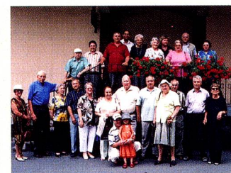
Le Cercle suisse de Mulhouse lors de la visite de la Distillerie Fassbind.