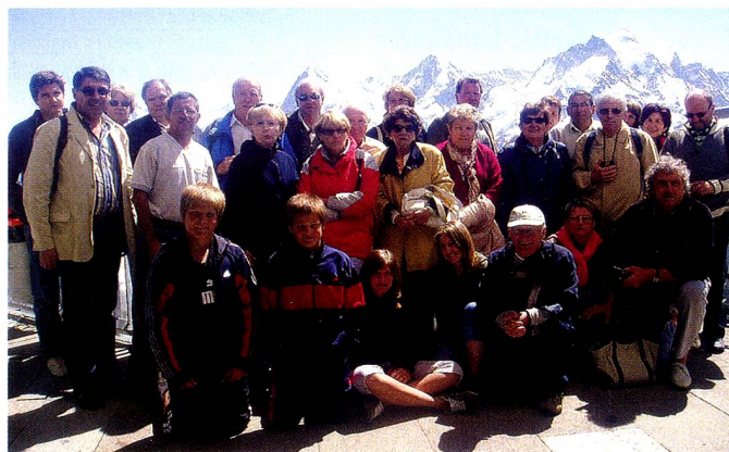
Les membres de l'USG au sommet du Schiltorn