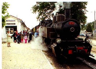
La belle fumante prête à bondir !