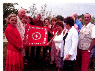
L'Amicale des Suisses de Bretagne