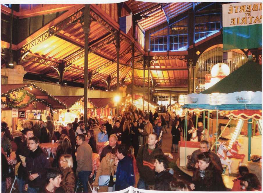
Au marché Couvert de Montreux