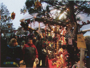
Stans, centre du village

Du côté de la cité historique de Willisau (LU), le 9 e marché de Noël (100 stands) prend place du 1 er au 4 décembre au centre-ville (là où les marchés conventionnels ont lieu depuis le Moyen Âge). Quant au marché de Noël de Brunnen dans le canton de Schwyz, il est pour