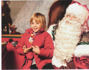
Magie de Noël pour petits et grands

tionner des bougies, par là le Père Noël donne audience. Dénombrer les marchés de Noël dans notre contrée, c'est chercher des edelweiss sous un manteau de neige. En une dizaine d'années, l'engouement pour ces rassemblements a explosé. Petits ou grands, authentiques ou carrément à côté du sujet, ces marchés d'origine germanique (Alsace, Bavière) ont séduit les Helvètes. L'hiver s'anime. Les ruelles scintillantes voient naître des villages de maisonnettes en bois, de stands. A l'hibernation de jadis se substitue la chaleur de l'échange culturel, commercial et social. Du tourisme contemplatif dans un décor féérique. Le fantastique qui s'en dégage, les choses simples (travail du bois, d'artisans) oubliées d'une société pressée et haletante, contribuent pour beaucoup à ce succès.