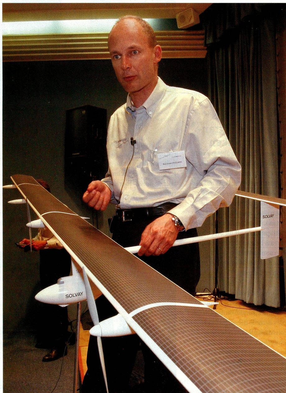
Bertrand Piccard présente le modèle du «Solar Impulse».

A quelle altitude volera l'avion solaire? Selon les prévisions: 12 000 mètres la journée et 3 000 mètres la nuit. «A 12 000 mètres, on se trouve au-dessus de la plupart des nuages. Mais on fera des détours s'il faut en éviter. Le but absolu – Luc Trullemans, expert météorologique, sera là pour nous le garantir –, étant que l'on soit au-dessus des nuages.» Il se peut donc