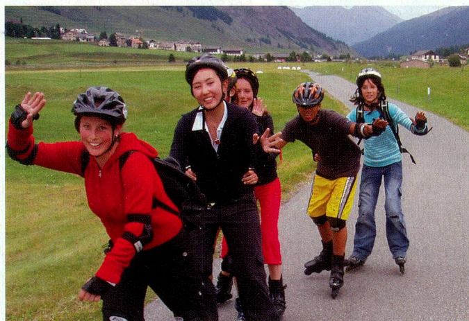
Patin en ligne autour de La Punt (Engadine)

Les problèmes financiers récents de certaines écoles suisses étaient l'un des thèmes traités. Sans rechercher à tout prix le bénéfice, les établissements doivent quand même encaisser plus qu'ils ne dépensent pour conserver ou développer leurs infrastructures. La direction d'une école qui affrontait de tels problèmes a dû réduire massivement les salai-