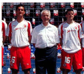
Köbi Kuhn, entraîneur national