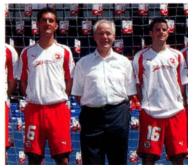
Köbi Kuhn, entraîneur national