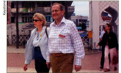
Le conseiller fédéral Deiss (et son épouse) en visite en Indonésie.

Par contre, les Suisses ont un peu boudé les séjours dans leur propre pays: les nuitées sont en baisse de 2,8%. «Les marchés d'avenir» du tourisme suisse sont la Chine, la Corée, les Etats-Unis et les pays du Golfe.