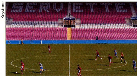
Faillite du FC Servette (Genève).