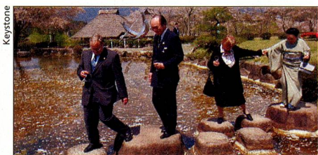
Le président de la Confédération Schmid à l'exposition universelle.

23 mars. Ouverture de l'expo universelle d'Aichi au Japon: la Suisse culturelle ne se contente pas du pavillon suisse pour faire sa place au «soleil levant». Pro Helvetia a mis au point un riche programme sur deux ans à travers tout le pays pour mettre en valeur l'art contemporain helvétique. Le 16 avril, le président de la Confédération Samuel Schmid visitait le pavillon «La sagesse de la nature» qui verra défiler quelques 15 millions de visiteurs jusqu'à fin septembre.