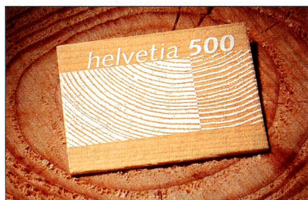
En bois: l'accent a été mis sur la matière première durable et polyvalente lors de la réalisation et de la conception du timbre, soulignant ainsi non seulement le caractère unique de ce timbre mais aussi l'esprit novateur de la Poste.