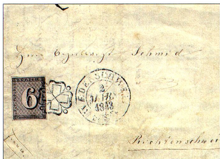
Première suisse: la première lettre connue en Suisse à avoir été affranchie au moyen d'un timbre, datée du 2 avril 1843.