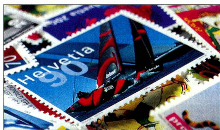
Mondialement connu: le timbre-poste spécial «Alinghi, Switzerland» a connu un succès retentissant. Les feuilles miniatures étaient déjà épuisées peu de temps à peine après l'émission du timbre.