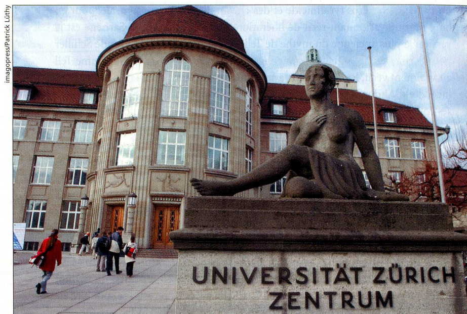
Les hautes écoles suisses entendent tenir compte de la mobilité.

LA FORMATION TERTIAIRE est une «priorité du Conseil fédéral», déclarait Pascal Couchepin, patron de l'Education, en décembre. A commencer par ce formidable processus déclenché à Bologne en 1999 par les ministres de l'Education des 29 pays européens signataires, dont la Suisse, par le paragraphe de Charles Kleiber, secrétaire d'Etat à la science et à la recherche. Signée symboliquement dans la plus ancienne université d'Europe, la «Déclaration de Bologne» crée des diplômes facilement lisibles et comparables, un «espace européen de l'éducation supérieure» qui encourage la libre circulation des étudiants et des enseignants dans le but de favoriser l'emploi. Particularismes et souverainetés académiques sont rabotés pour rendre le paysage académique compétitif à l'échelon mondial. Ce sursaut préserve toutefois une certaine diversité, «caractéristique européenne» et ô combien helvétique. Le processus prévoit aussi d'instaurer des critères d'évaluation de la qualité et d'encourager la coopération entre institutions. Bref, d'ici à 2010, les universitaires eu-