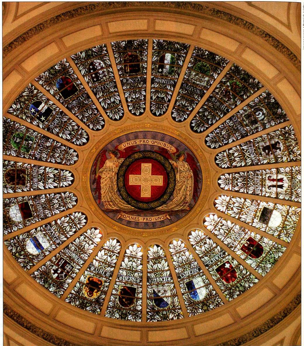
Vue de la coupole du Palais fédéral, avec croix suisse et armoiries cantonales.

Chaque parti dépose ses propositions auprès de l'autorité cantona-