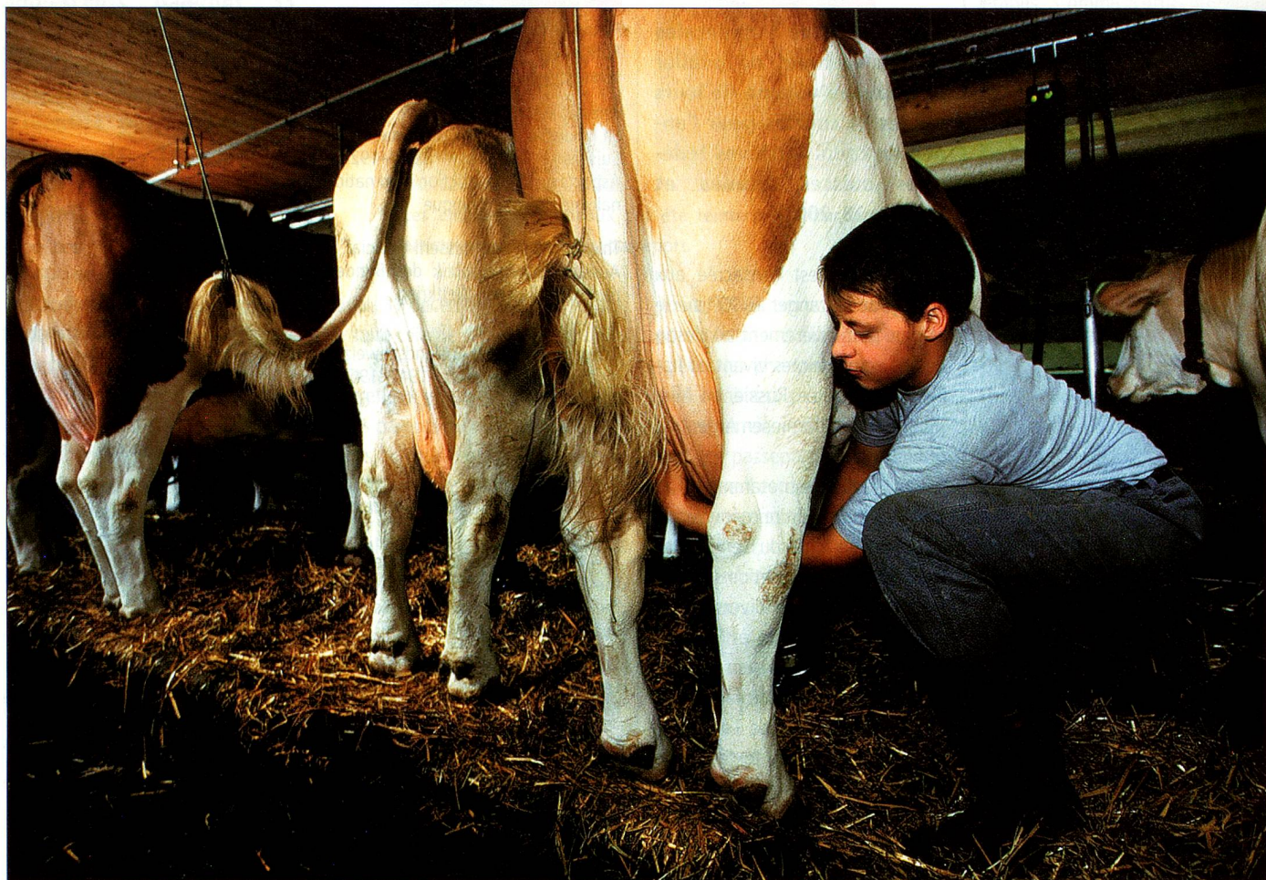
La suppression du contingent laitier pourrait provoquer l'effondrement des prix.