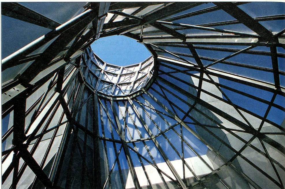
Des tourbillons sonores déferleront bientôt de cette tour impressionnante de l'arteplage de Bienne.

lisent la puissance. Hautes de 38, 42,7 et 35 mètres, elles ont une vie intérieure très particulière. L'une des tours offre un escalier et un ascenseur, tandis que dans la tour ronde, dite «des sons», on entendra des bruits insolites. Chacune des tours s'appuie sur quatre pieds, capables de supporter chacun 200 tonnes. Et chaque pied repose à son tour sur quatre piliers de 50 mètres de long, ancrés directement au fond du lac. Pour accéder au parc urbain de l'exposition, les visiteurs emprunteront