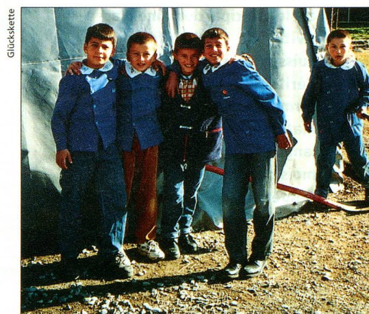
Des classes provisoires ont permis à 26 000 enfants de retourner à l'école après le tremblement de terre en Turquie.

Pourquoi la Chaîne du Bonheur s'intéresse-t-elle tant à votre adresse e-mail? En cas de catastrophe, les collectes sont mises sur pied en quelques jours. Internet est le seul moyen de vous contacter rapidement où que vous soyez dans le monde. Avec swissinfo/SRI (également partenaire de cette action), c'est la seule façon pour vous de prendre connaissance à temps des dates de