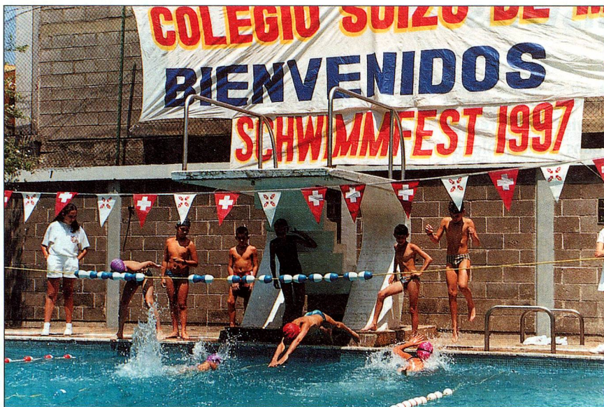
Le sport à l'honneur: l'école suisse à Mexico

«Vous pensez que les Suisses de l'étranger doivent être mieux considérés par le gouvernement et le parlement suisses? Participez aux votations et élections, c'est le meilleur moyen de vous faire entendre!»