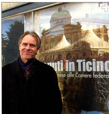
Le président de la Confédération M. Leuenberger à Lugano

Mais ce séjour au Tessin n'a pas été fait que d'excursions et de manifestations conviviales. Le parlement a enfin mené à terme la révision des dispositions du Code pénal relatives à l'interruption de grossesse. Par égard pour le PDC, il a finalement opté