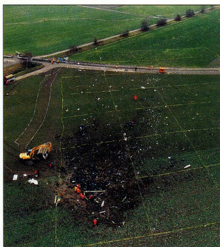
Le Saab 340 de Crossair s'est écrasé près de Niederhasli (ZH) peu après son décollage.

Un avion suisse s'est écrasé en Libye. 22 des 41 occupants de l'appareil affrété par la compagnie aérienne zurichoise Avisto AG