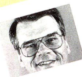
Parti suisse de la liberté (PSL)

Le parti libéral suisse souhaite gagner 3 sièges au Conseil national. Au travers de tous les grands débats, nous souhaitons affirmer une ligne et une attitude libérale qui ne se laisse influencer ni par le vent de la socialisation, ni par les excès de la droite dure. Le parti libéral suisse a regretté que l'enjeu de cette révision ait été sous-estimé pour les Suisses résidant à l'étranger.