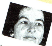
Parti socialiste suisse (PSS)

Devenir le plus important groupe parlementaire, doubler la députation féminine et rajeunir notablement le groupe. Le PRD veut réformer la Suisse de manière responsable, afin de maintenir autant de liberté que possible, tout en créant autant de sécurité que possible. Le PRD a prié le Conseil fédéral de renoncer à limiter l'accès à l'AVS facultative, étant donné que cette assurance sociale revêt une grande importance pour nos compatriotes âgés vivant à l'étranger.