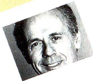
Parti libéral suisse (PLS)

Nous voulons maintenir le nombre de nos sièges au Conseil national. Le PSS entend œuvrer pour le maintien de la cohésion sociale dans notre pays et pour que celui-ci prenne davantage de responsabilité sur le plan international. Le PSS soutient les propositions du Conseil fédéral. Il demande toutefois des mesures complémentaires pour la protection des personnes encore en formation et pour les jeunes qui débutent dans la vie active.