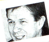
Parti radical-démocratique suisse (PRD)

3 Quelle est la position de votre parti concernant le message du Conseil fédéral du 28 avril 1999 sur la limitation de l'AVS/AI facultative?