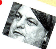
Lega dei Ticinesi (Ligue des Tessinois)

Le PEV souhaite obtenir 5 mandats, afin de pouvoir constituer un groupe parlementaire. Nous nous engageons sur les questions d'éthique, de politique sociale, d'environnement et de transports. L'AVS facultative doit en principe être maintenue.