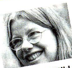
Frauen macht Politik! (FraP!)

La Lega aspire à 2 sièges au Conseil national. Nous militons pour une politique d'asile plus restrictive et combattons le rapprochement de la Suisse de l'UE. Nous sommes opposés à une limitation de l'AVS facultative.