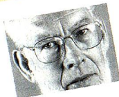
Parti évangélique de la Suisse (PEV)

Le PSL veut obtenir 5 à 8 mandats. D'une part empêcher l'adhésion de la Suisse à l'UE, à l'ONU et à l'OTAN, d'autre part lutter contre l'augmentation des impôts, taxes et redevances. Le PSL n'a pas encore d'opinion définitive à ce sujet. En règle générale, le parti est en faveur du maintien de cette importante œuvre sociale, sans déductions supplémentaires sur les salaires.