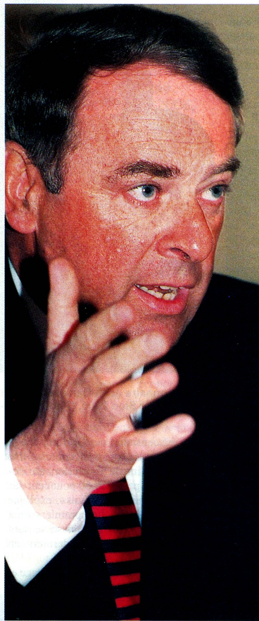
Le conseiller fédéral Adolf Ogi pense que le sport sauvera la Suisse de son isolement.

Monsieur le conseiller fédéral, pourquoi notre pays a-t-il besoin d'une manifestation de l'importance des Jeux Olympiques de 2006?