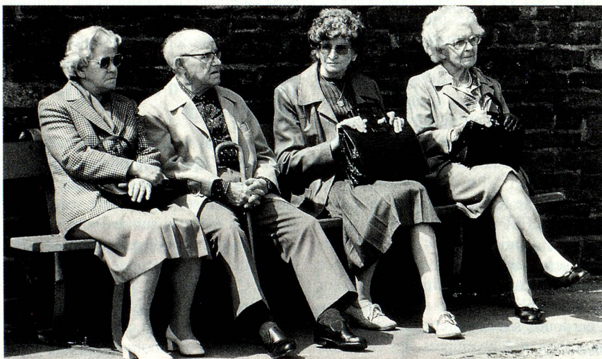
Leur rente AVS est encore garantie, mais qu'en sera-t-il en 2010?

Quelques lignes enfin sur une assurance sociale dont les experts ne soufflent mot et qui a pourtant été prise en compte dans les calculs: l'assurance maternité. Elle devrait compléter dans quelques années la palette des assurances sociales. Le Conseil fédéral propose de lui donner la forme d'une assurance perte de gains pour les femmes qui exercent une activité lucrative et d'une allocation de naissance pour les femmes, salariées ou non, vivant sur un faible revenu. Coûts: près de 500 millions de francs.