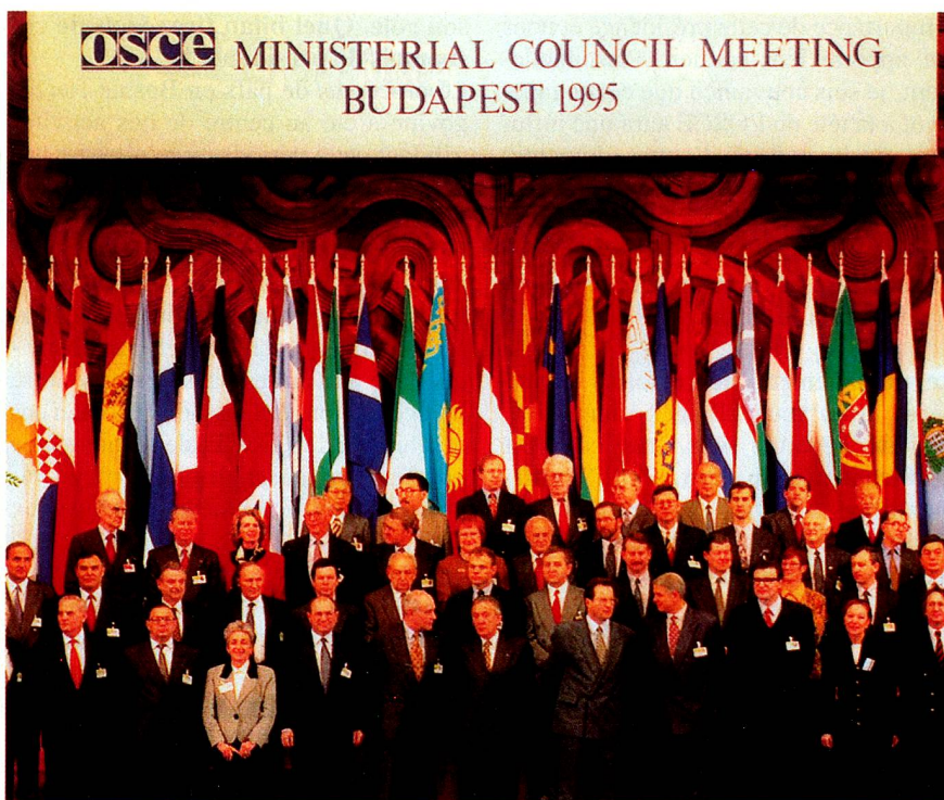
Le passage de témoin de la présidence s'est fait au Conseil des Ministres de l'OSCE à Budapest en décembre dernier. Officiellement, la présidence de la Suisse a débuté le 1 er janvier 1996.

Avec l'assistance de la Hongrie et du Danemark, la Suisse assume cette année la responsabilité générale de l'exécution des tâches de l'OSCE (conduite des opérations de diplomatie préventive, prise d'initiatives en cas de crises ou lors de violations des obligations de l'OSCE et présidence des différents organes).