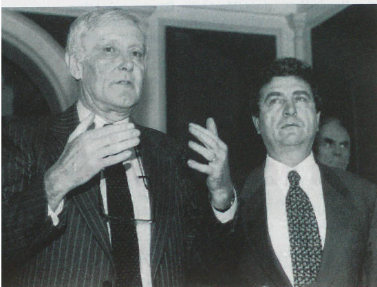
Flavio Cotti avec le premier ministre bosniaque Hasan Muratovic.

Notre groupe d'assistance établit ses quartiers dans une maison qui, bien que proche du centre et dans un voisinage pratiquement en ruines, était restée presque intacte. Nous habitions une construction typique du nord du Caucase, composée de deux petites maisons reliées par une loggia qui, pendant l'été et jusque tard dans l'hiver, nous servait de cuisine, de salle de séjour et de bureau. Nous avions des fenêtres, mais pas de portes. Nous avions bien du gaz et une conduite dans la cour qui livrait sporadiquement de l'eau, mais pas d'électricité – ce qui n'avait rien d'étonnant compte tenu des destructions. Aussi passions-nous nos soirées, les premiers