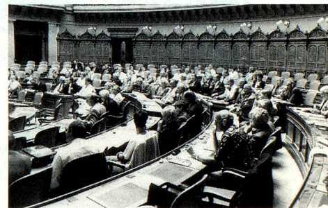
La séance bien fréquentée du Conseil des Suisses de l'étranger dans la salle du Conseil national.

Des élections en vue du renouvellement intégral du CSE avaient eu lieu en 1993, si bien que la session de cet automne coïncidait avec la fin de la première moitié de la période d'exercice des fonctions 1993-97. Cela a été l'occasion pour le président, l'ancien conseiller national Jean-Jacques Cevey, de faire le bilan à mi-parcours. A côté de succès importants – suppression de l'AVS/AI facultative évitée à deux reprises, maintien des subventions en faveur des écoles suisses à l'étranger, prise en compte des intérêts des Suisses de l'étranger lors de la révision en cours de la loi sur la nationalité – il y a aussi des «dossiers pendants»: développement de l'information, reconnaissance des diplômes, restructuration du réseau des re-