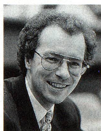
Rudolf Keller, président des Démocrates suisses

C'est en 1961 qu'est née l'Action nationale, rebaptisée il y a cinq ans «Démocrates suisses». Elle est donc de loin l'aînée des formations de la droite populiste. Sa cause était et reste la défense de l'identité et des valeurs helvétiques contre une présence étrangère jugée trop forte. En 1971, les «nationalistes» remportaient 11 sièges au Conseil national.