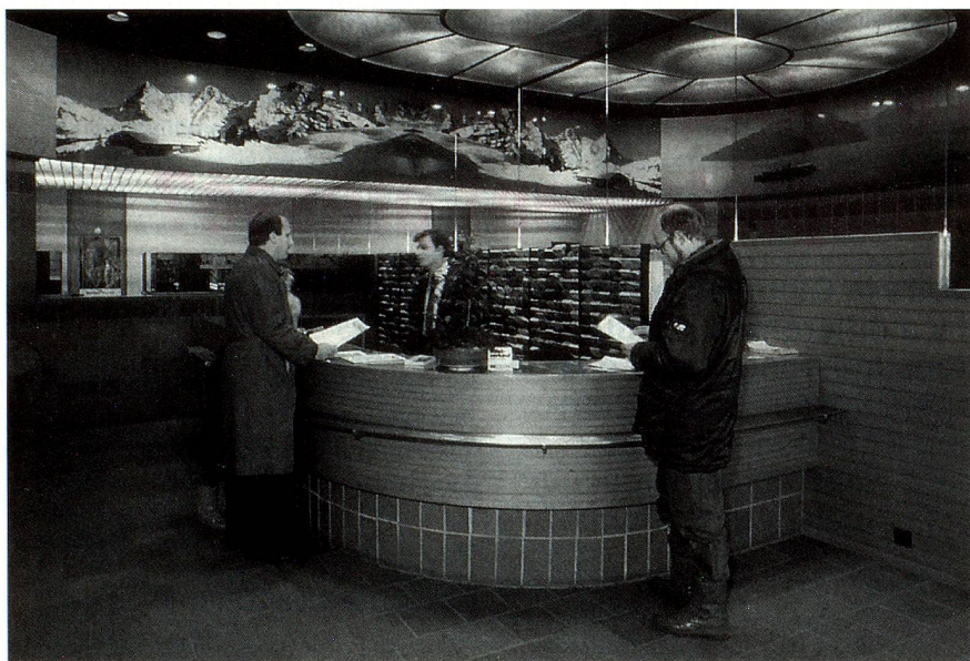
Economiser même dans le domaine de notre présence à l'étranger? Par exemple dans celui des agences de l'Office national suisse du tourisme?