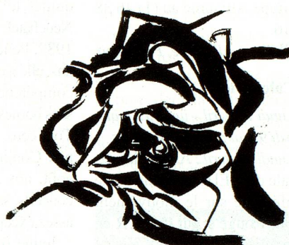
L'affiche de collection, sérigraphiée sur papier Velin d'Arches (format 76 x 56) en hommage à Bruno Müller, reste disponible au prix de 150,00 F à l'ordre de la SPSAS Paris.

Il y a coïncidence avec vous, public illustre, réuni ce soir à l'occasion de notre vernissage. En résumé je voudrais vous dire : faire