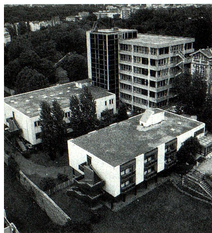
L'Hôpital Suisse de Paris à Issy-les-Moulineaux

L'Hôpital Suisse de Paris, parmi les associations suisses de France, de loin la plus importante, puisque son budget est de 60 millions de francs. Il compte, à temps plein ou partiel, plus de 200 personnes, dont 20 médecins. C'est, par ailleurs, le seul hôpital suisse au monde.