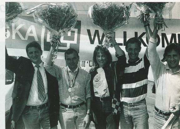
...et aussi les cavaliers.

de francs à des sportifs d'élite. Cela ne suffit naturellement pas pour permettre aux athlètes d'exercer leur activité d'une manière encore plus professionnelle. Il ressort d'une analyse que le sport génère actuellement en Suisse un chiffre d'affaires compris entre 16 et 18 millions de francs. Aujourd'hui, on porte des baskets non seulement pour le sport mais également en ville. Le sport influence énormément la mode des loisirs, de même que l'hôtellerie, etc. Il est donc normal que les milieux économiques apportent leur contribution afin que le sport, qu'ils utilisent tellement pour leur publicité, puisse à l'avenir également être encouragé, et même davantage que jusqu'ici.