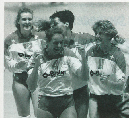
Elles ont de bonnes raisons de se réjouir: les volleyeuses suisses...