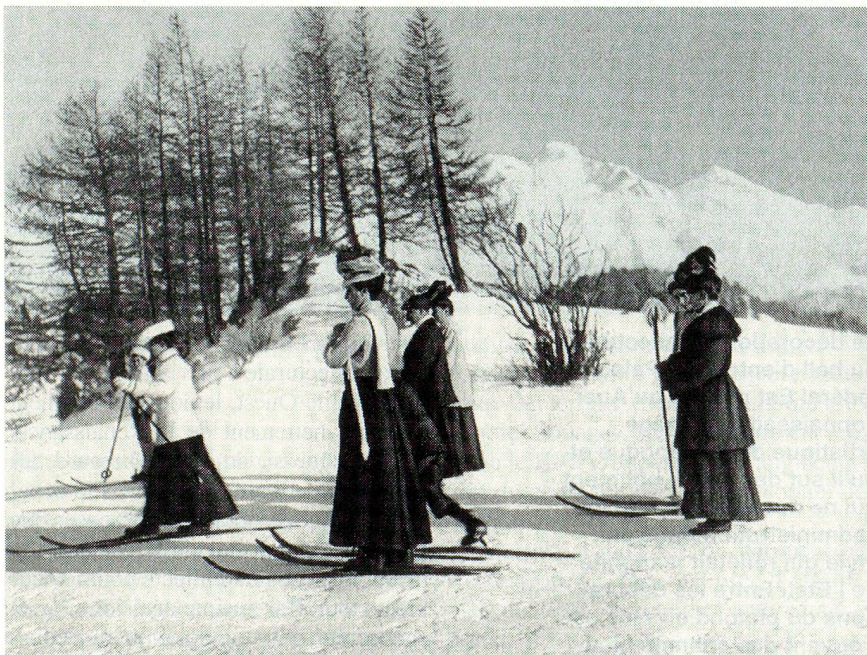
L'Office national suisse du tourisme a été fondé il y a 75 ans: des skieuses de cette époque.

● Dans une caverne militaire au col du Susten (canton de Berne), qui sert à l'entreposage souterrain d'explosifs non recyclables, 300 à 400 tonnes ont explosé pour des causes encore inexpliquées. La caverne elle-même est enfouie sous 50 000 m 3 de rochers et de débris. Six personnes ont perdu la vie dans cet accident.