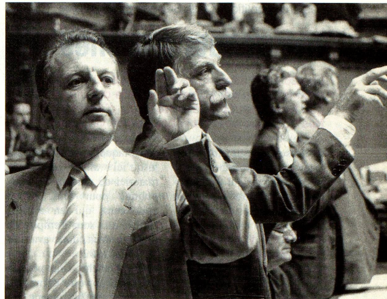
Scrutateurs au travail: quelle sera la décision du Parlement?

Tout citoyen suisse, où qu'il vive, peut prétendre à une rente de vieillesse suisse s'il a payé ses cotisations pendant une année au moins. Il en va de même pour les survivants (veuves ou orphelins). Cela ne joue aucun rôle que les cotisations aient été versées à l'assurance obliga-