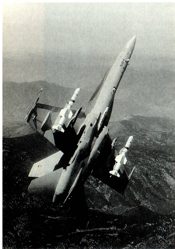
On ne sait pas encore si des «Hornets» voleront un jour avec l'emblème suisse.

Nos relations avec la CE constituent sans doute aujourd'hui le thème le plus important de la politique suisse. Pour beaucoup, il en va là de l'identité suisse. L'auteur explique des notions telles que EEE, Union économique et monétaire ainsi que Union politique, et met en lu-