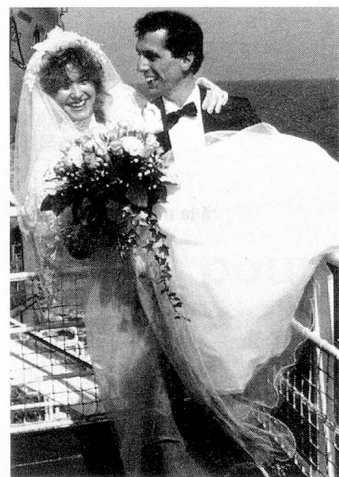
Pour une étrangère, épouser un Suisse ne veut plus dire acquérir automatiquement la nationalité suisse.

Contrairement à ce que prévoyaient les dispositions antérieures, une Suissesse de l'étranger qui épouse un étranger ne perd pas la