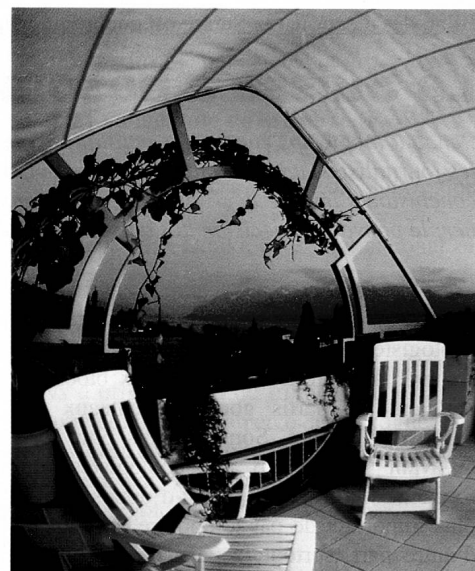
Vue sur le lac Léman et les Alpes

Conçus en duplex et en triplex, avec comme en villa, de larges baies ouvertes sur la nature, ce type d'habitation offre de nom-