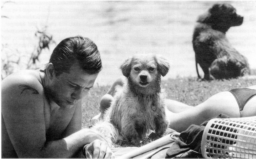
Tout le monde a du plaisir à lire la «Revue Suisse»...

Alors que la partie mondiale (pages blanches) de la «Revue Suisse» (RS) a partout le même contenu, les pages régionales (vertes) diffèrent selon les régions. Dans le tableau ci-dessous, vous pouvez voir quels pays ou continents ont leurs propres pages régionales et dans quelle langue la RS y est distribuée. L'Italie, le Liechtenstein et les Etats-Unis ont non seulement leurs propres informations locales mais encore leur propre revue: (1) «Gazetta Svizzera», (2) «Schweizer Bulletin» et (6) «Swiss American Review». Ces revues reprennent de la partie mondiale de la RS au moins les communications officielles et celles du Secrétariat des Suisses de l'étranger.