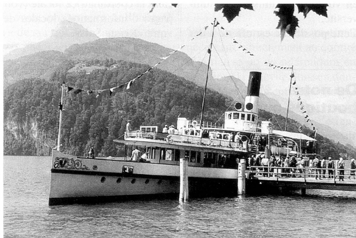
Lors de la traditionnelle excursion du dimanche, les congressistes se sont rendus à Brunnen en bateau.

Il ne saurait être question, pour A. Koller, de nous enfermer dans le cas spécial que constitue la Suisse. Il convient de ne pas laisser le réseau dense de nos méca-