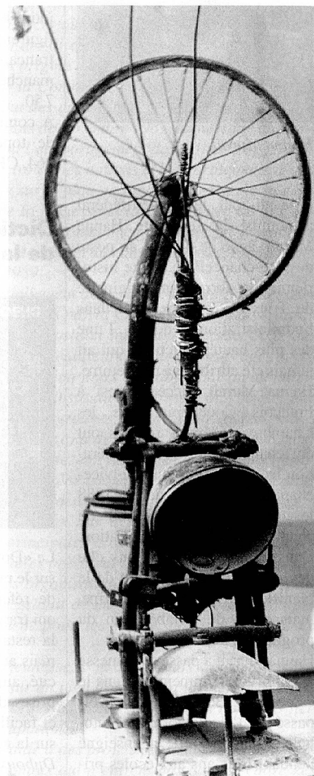
Jean Tinguely. «Hommage à Duchamp», 1965.

Le 29 août s'est éteint à Berne des suites d'une attaque l'artiste fribourgeois mondialement connu, Jean Tinguely, qui était âgé de 66 ans.