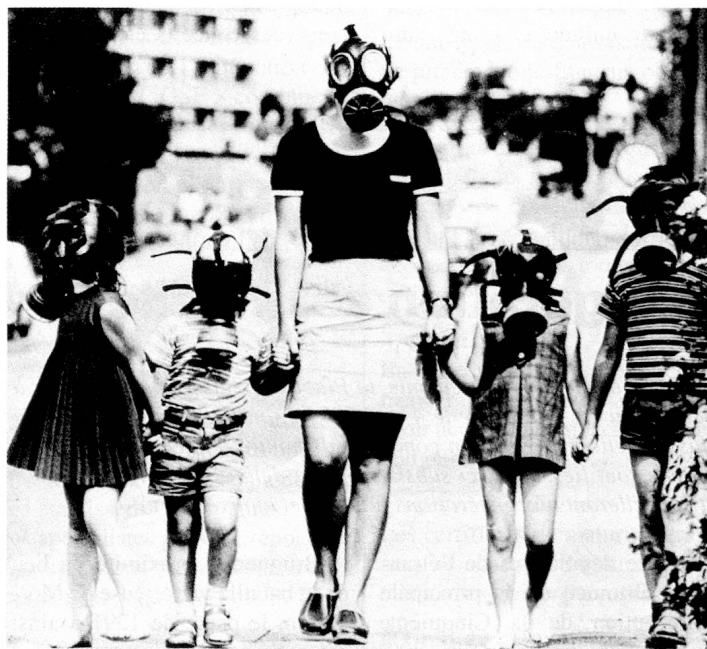
Même en dehors des villes, la pollution atmosphérique atteint en Suisse des valeurs critiques.

L'interdiction, dès 1995, des 500 000 voitures sans catalyseurs, qui est très controversée, est pour le moment renvoyée à plus tard.