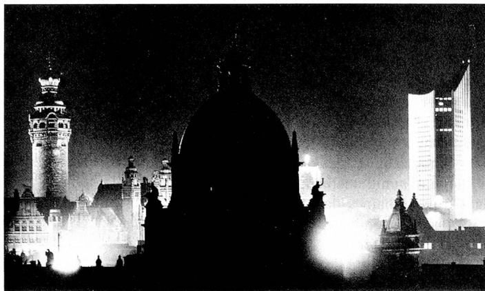
Sur demande, les banques de RDA convertissent en DM les comptes en devises nationales. Notre illustration (de gauche à droite): l'Hôtel de ville, le musée Dimitroff et l'Université de Leipzig.

Dans le cadre de la réorganisation monétaire intervenue en République fédérale allemande, le mark allemand (DM) est devenu, le 1 er juillet 1990, la monnaie officielle de la RDA.