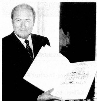
Joseph Blatter.

des femmes dans l'Eglise catholique; d'ailleurs, sa nomination comme évêque coadjuteur en 1988 avait déjà été vivement contestée.