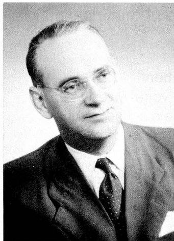
Carl Lutz.

En 1944, Carl Lutz, qui était alors vice-consul de Suisse et chef de la division de la protection à Budapest, a réussi à sauver la vie de plusieurs milliers de Juifs hongrois grâce à une méthode géniale. Un monument de bronze sera inauguré en son honneur au mois de décembre prochain au centre de la capitale hongroise.