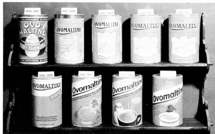
Emballages d'Ovomaltine autrefois et aujourd'hui. (Photo d'archive)

Pour beaucoup de gens, Wander est synonyme d'Ovomaltine, et cela à juste titre. Ce produit, composé de malt d'orge, de lait, d'œufs, de levure et d'un peu de cacao (sans sucre ni substances de lest) a été l'une des premières créations de Wander et a connu le succès dans le monde entier. Mais l'Ovomaltine n'est pas simplement née de l'idée géniale d'un jour, mais a été le fruit de nombreuses années de recherche et d'étude de nouvelles méthodes. Cependant, cette entreprise, qui n'occupait à ses débuts que