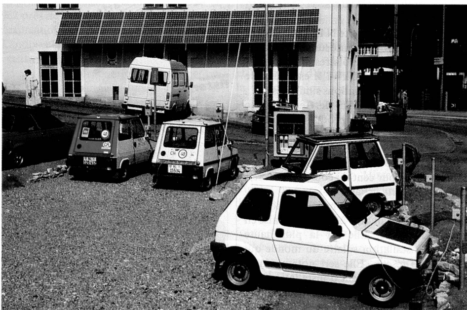
Les voitures électriques font le plein de «soleil» à Liestal.

Ces derniers temps, les pouvoirs publics et des particuliers intéressés ont commencé à soutenir divers projets solaires même dans des secteurs où l'énergie solaire n'est aujourd'hui pas encore vraiment rentable. Peu à peu, les gens ont révisé leur jugement, notamment en raison des catastrophes nucléaires de Three Mile Island et de Tchernobyl, des accidents toujours plus fréquents dans les centrales nucléaires, des modifications prévues du climat dues aux combustibles d'origine fossile ainsi que du fait, connu depuis longtemps, que ceux-ci ne sont pas inépuisables. Tout récemment encore, les pouvoirs publics n'accordaient, dans leurs budgets de la recherche, que des miettes pour la recherche dans le domaine de l'énergie solaire.