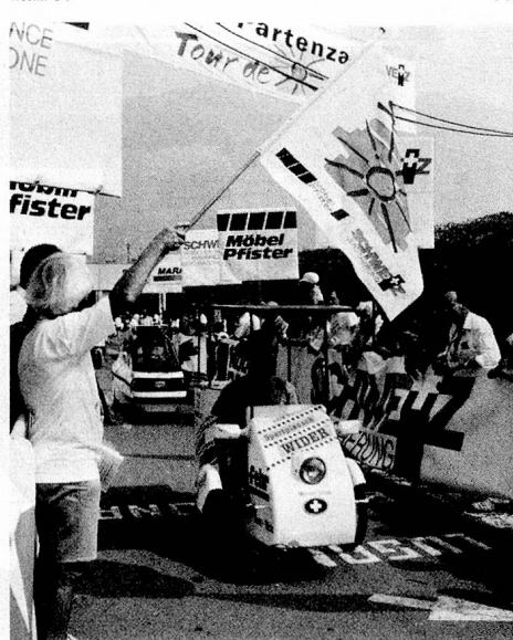
La course de voitures solaires «Tour de Sol», une œuvre de pionniers de l'énergie solaire en Suisse.

■ L'année passée déjà, une installation solaire d'une puissance de 2,5 kW a été mise en service au Titlis. Elle est la plus haute (2540 m) installation solaire du monde qui alimente le réseau. Elle sert notamment à étudier le comportement d'installations solaires dans des conditions atmosphériques extrêmes.