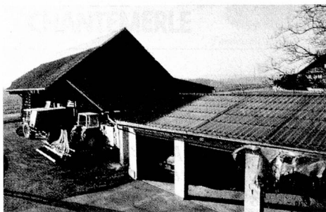
Utilisation de l'énergie solaire dans l'agriculture.