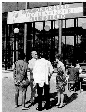
Lieu de rencontre: le Congrès des Suisses de l'étranger.