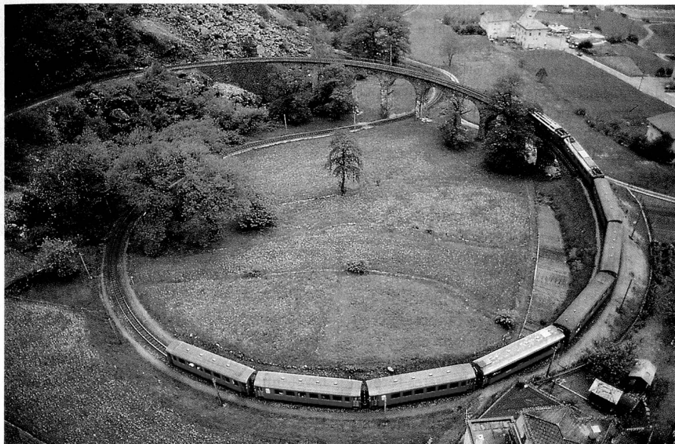
Viaduc en forme de cercle pour franchir la rampe située près de Brusio, dans le Val Poschiavo.

Le 9 octobre 1889, le convoi inaugural traversait le Prättigau sur la ligne Landquart-Davos, la première des chemins de fer des Grisons, qui s'appellent aujourd'hui «Chemins de fer rhétiques» (RhB). C'est actuellement la compagnie privée qui a le plus grand réseau de Suisse (375 km).