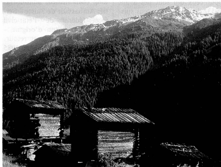
Val d'Anniviers.