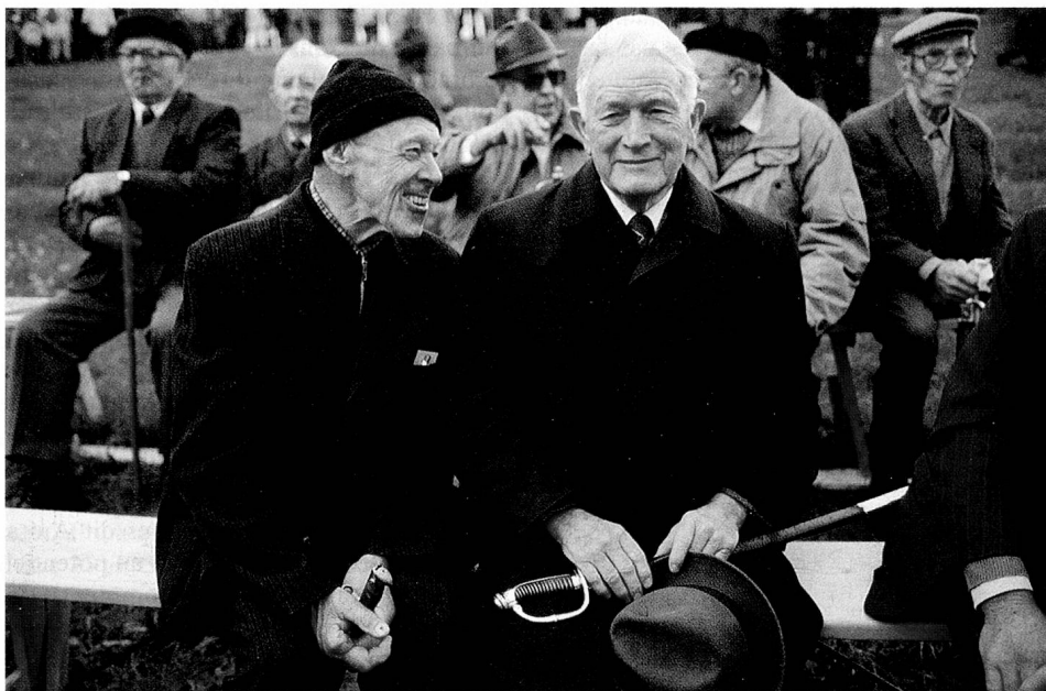
Pour la dernière fois entre eux: les hommes des Rhodes-Extérieures à la landsgemeinde (avec l'épée servant de carte d'électeur).

La question du droit de vote des femmes dans le canton d'Appenzell n'est pas l'un des chapitres les plus glorieux de notre démocratie. Le demi-canton d'Appenzell Rhodes-Extérieures vient de décider d'accorder le droit de vote aux femmes. Il est l'avant-dernier (demi-)canton et, à notre connaissance, l'avant-dernier Etat du monde à le faire. Après quatre votes négatifs, la landsgemeinde (composée d'hommes) du 30 avril 1989 à Hundwil s'est enfin prononcée en fa-