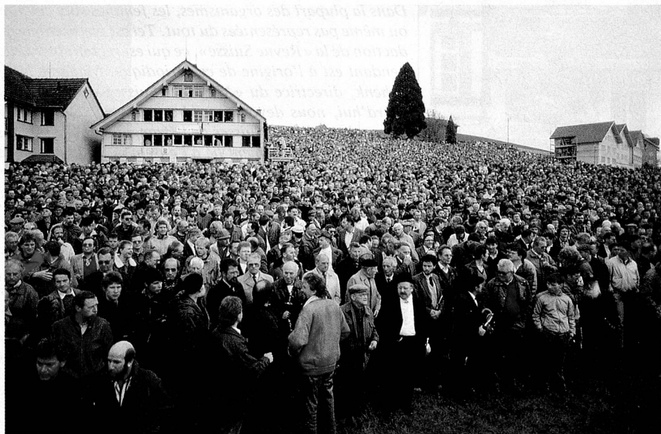
La landsgemeinde historique du 30 avril 1989 à Hundwil (Appenzell Rhodes-Extérieures): les femmes obtiennent enfin l'égalité des droits.