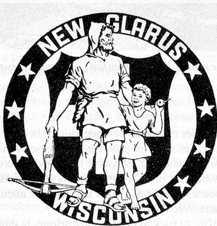
...faisant le tour du monde (colonie suisse de New Glarus aux Etats-Unis)...

Car Guillaume Tell n'a pas seulement, au haut moyen âge, libéré notre pays du joug des tyrans grâce à une flèche bien ajustée; il joue aujourd'hui encore un rôle plus important que jamais dans la politique et l'économie. On le trouve sur des enseignes de restaurants, des T-shirts, des chopes et des fromages. Il fait de la publicité pour des balances, des machines, des montres, des épingles, des briquets, des élixirs fortifiants, des crayons, des barrettes, des blue-jeans et des chaussettes d'hiver. Des bacs et des bateaux à vapeur à aubes portent son nom. Il va de soi qu'il est bien assuré, auprès de pas moins