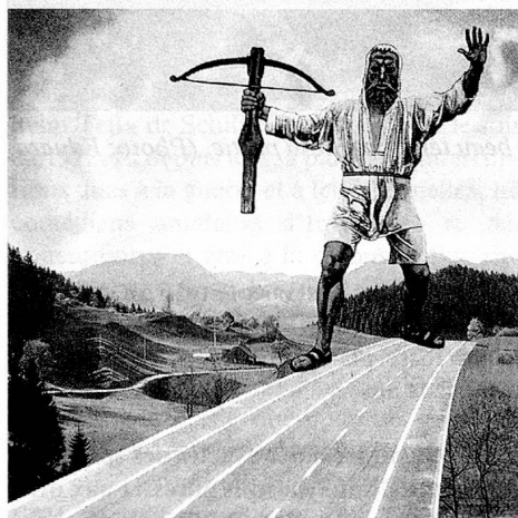
Guillaume Tell menant un combat politique («Halte au béton»)...