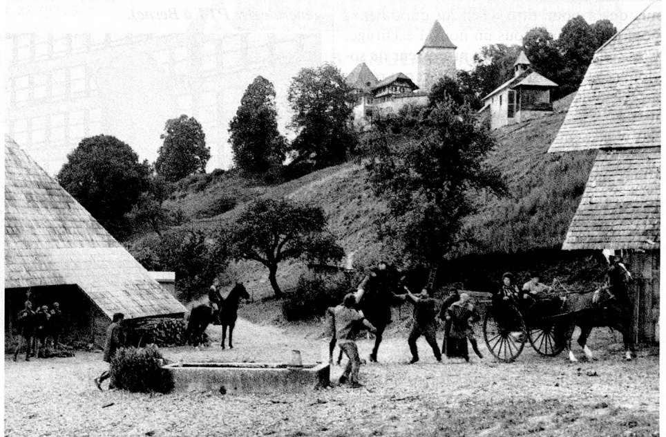
«L'araignée noire» de Gotthelf, sur un fond grandiose.

Pour obtenir les dates exactes des spectacles de plein air, veuillez vous adresser aux offices du tourisme régionaux ou à l'Office national suisse du tourisme, Bellariastrasse 38, CH-8027 Zurich.