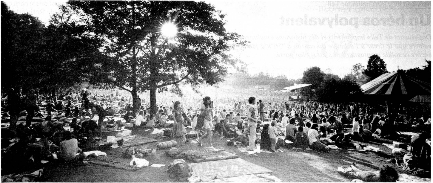
Lors des festivals en plein air, il règne toujours une atmosphère bon enfant, du moins lorsque le beau temps est de la partie.

et assit la puissance de Berne. Qu'importe, de juin à septembre une quinzaine de «son et lumière» évoqueront la terrible déculotée subie par les Fribourgeois entre Berne et Morat. Le spectacle, écrit par Hans-Rudolf Hubler, un ancien de la radio alémanique et un passionné de Laupen, aura pour cadre le château de la petite commune mais ne sacrifiera pas, lui, à la langue de Goethe. Le titre seul donne le ton: «Liechter uf Loupe».