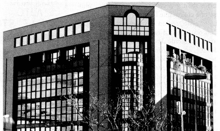
Lugano, ville de banques.