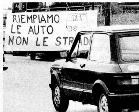
Protestation contre les pendulaires venant en voiture, dans le Malcantone: «Remplissons les voitures et non les routes.»

Ces chiffres montrent la profonde évolution de l'organisation territoriale cantonale. Le Tessin, une des régions les plus montagneuses de Suisse, est aujourd'hui parmi les plus urbanisées – le 76% de la population réside dans les quatre agglomérations de Lugano,