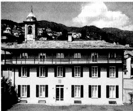
La Casa Rusca à Locarno abrite la collection d'œuvres d'art de la ville de Locarno ainsi que la collection Hans Arp.

L'image du canton de plus méridional de Suisse serait-elle donc en train de changer? Depuis quelques années, intellectuels et autorités essaient de redonner au Tessin une identité qui, pour certains, est déjà perdue et qui, pour d'autres, n'a jamais existé. Au-delà de ces divergences d'opinions, une chose est en tout cas certaine: la volonté de changer cette image existe. Elle se manifeste sous différentes formes. Au cours des cinq dernières années, cette volonté de sortir d'un certain isolement culturel s'est avant tout exprimée par une grande activité dans